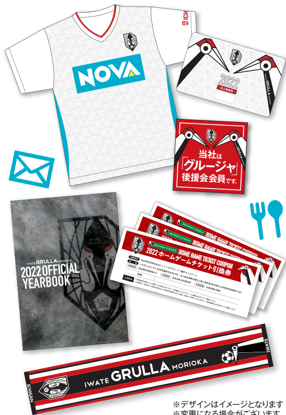
*デザインはイメージとなります *変更になる場合がございます